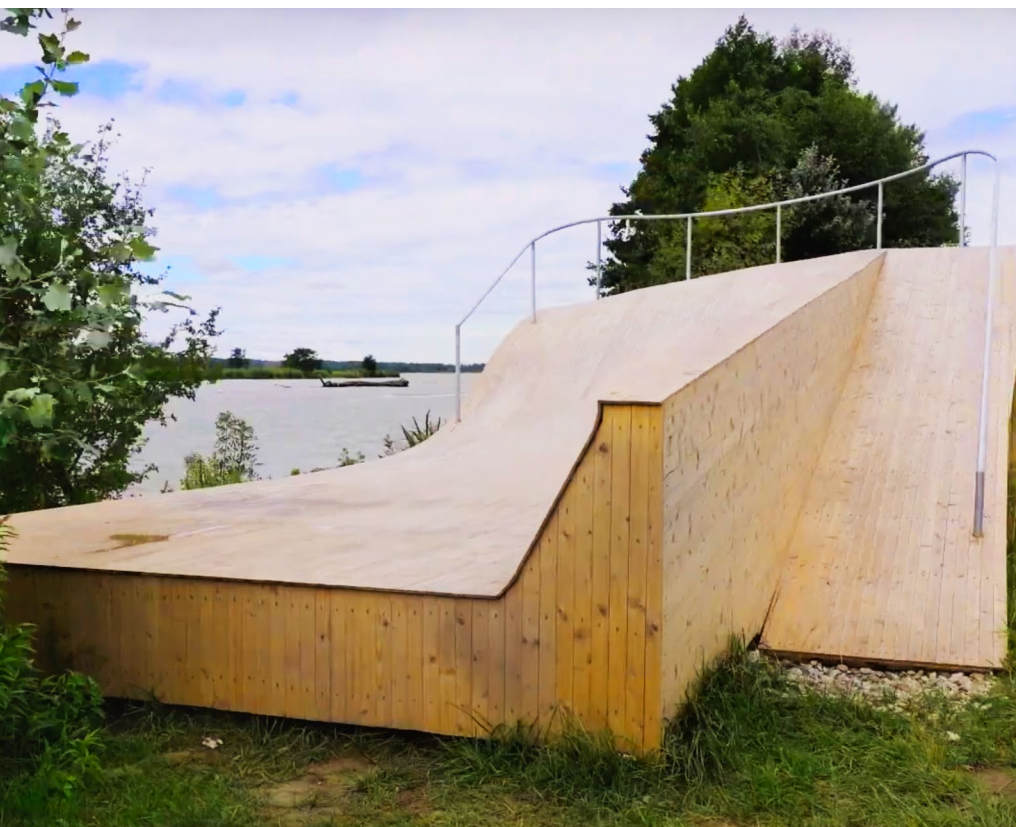
Pozorovateľňa vtákov Duna, Kalinkovo, Youtube

Vyhliadky a pozorovateľne sú miesta, ktoré poskytujú užívateľom iný, netradičný uhol pohľadu na verejný priestor či kúsok krajiny. Zmenou perspektívy odhaľujú ľuďom predtým nevidené krásy a kvality miesta. Netradičný zážitok zmenenej atmosféry na inak možno obyčajnom mieste tak môže zmeniť aj vnímanie mesta v očiach obyvateľov a návštevníkov.