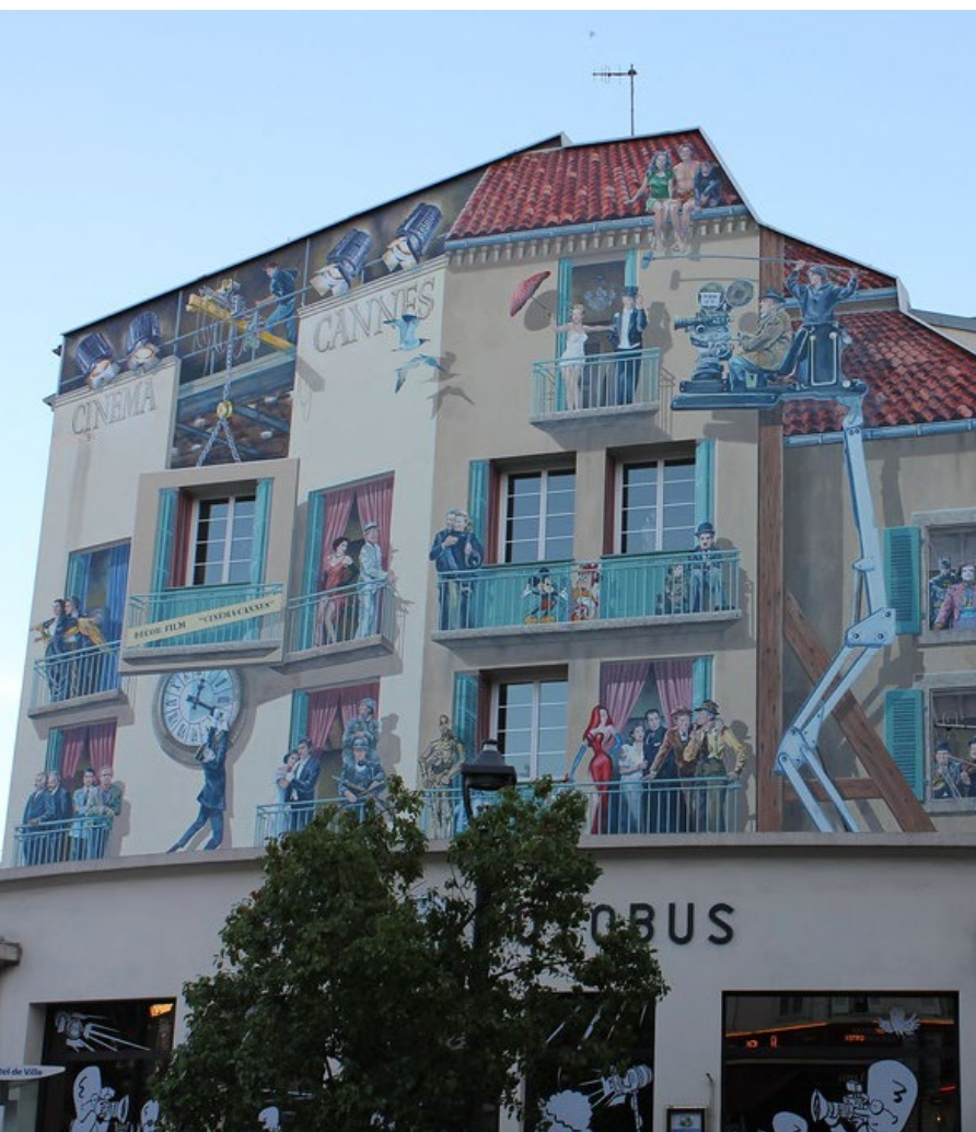
Obnova fasády kina, Cannes