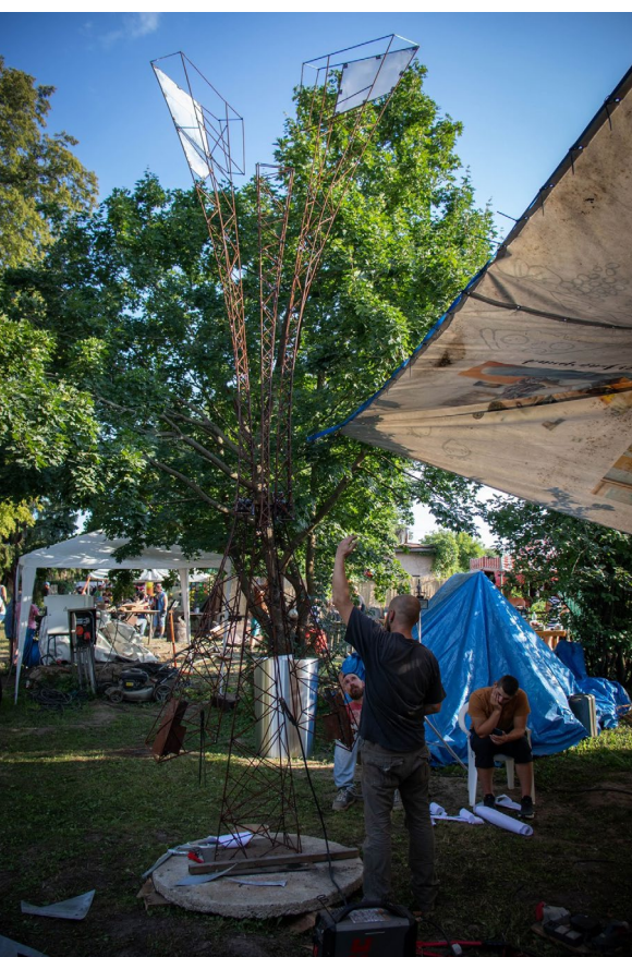
Sochárske sympóziu, Petrovany

Galérie sú dočasné výstavy, ktoré využívajú mestský priestor ako miesto inštalácie umeleckých diel. Vystavované diela tak dopĺňajú verejný priestor. Motivujú okoloidúcich zúčastniť sa umeleckého zážitku, hoci aj neplánovane. Práce umelcov v príkladoch z domova aj zo sveta siahajú od tradičných obrazových výstav, cez fotografie, sochy, interaktívne inštalácie až po media artové intervencie.