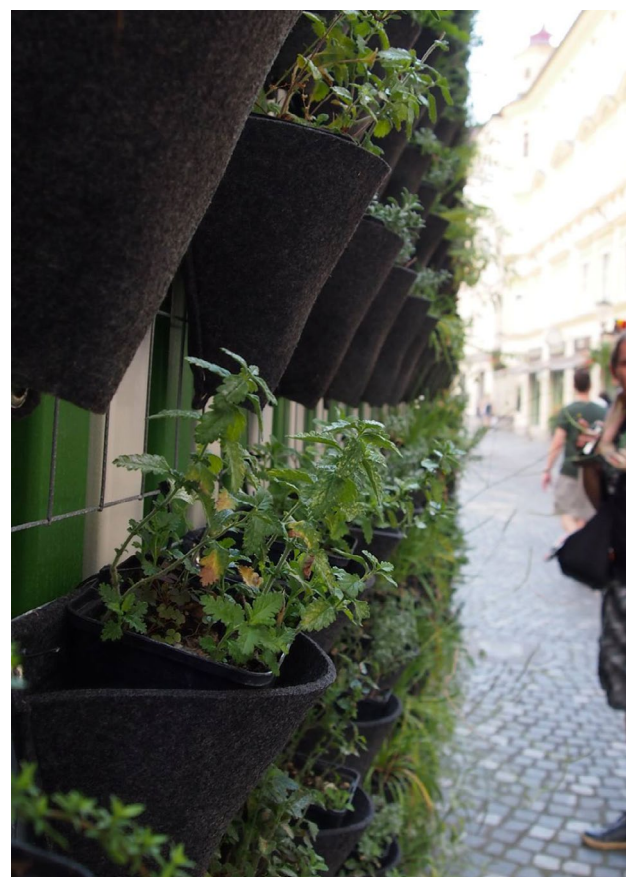
Vertikálna záhrada, Lubľana