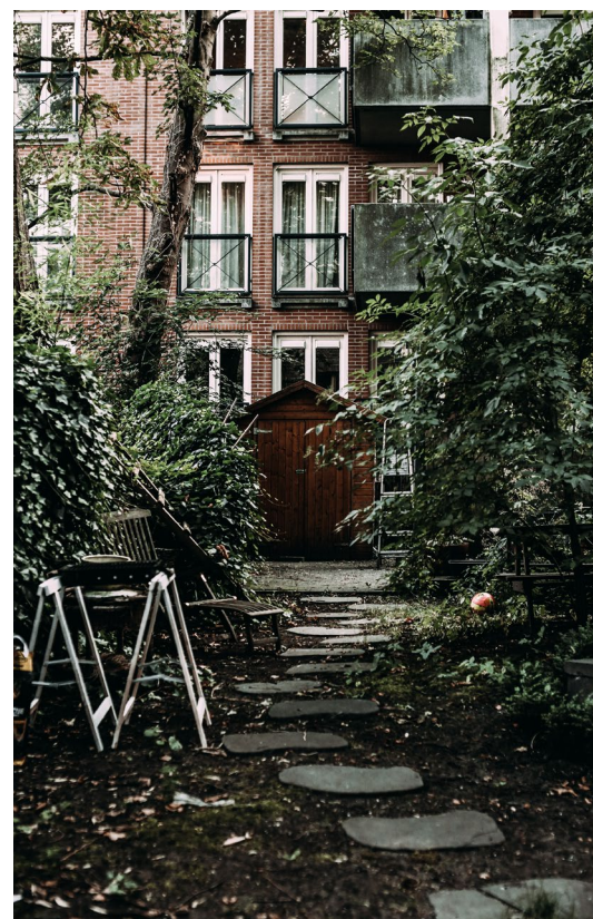
Obnova vnútrobloku