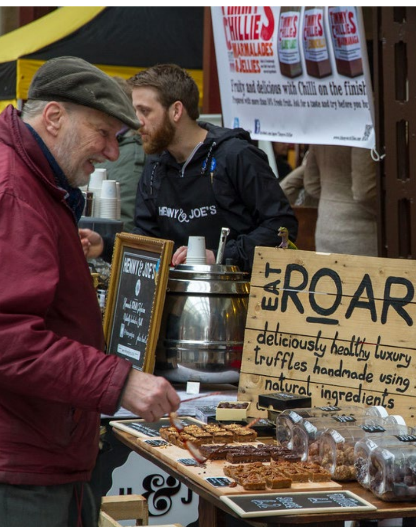
Trh remesiel, Bath

Koncept tradičných trhovísk a jarmokov sa vrátil do urbánneho priestoru v zmodernizovanej podobe a oživuje verejné priestory našich miest. Trhy bývajú často zamerané na potraviny, šperky, módu a iné výrobky. A to všetko poväčšinou od lokálnych výrobcov. Jarmoky môžu byť tematické, s kultúrnym programom, celomestské či komunitné.