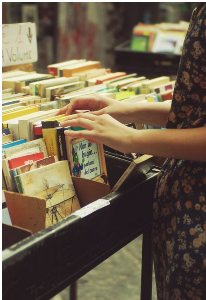
Swap kníh, Neapol