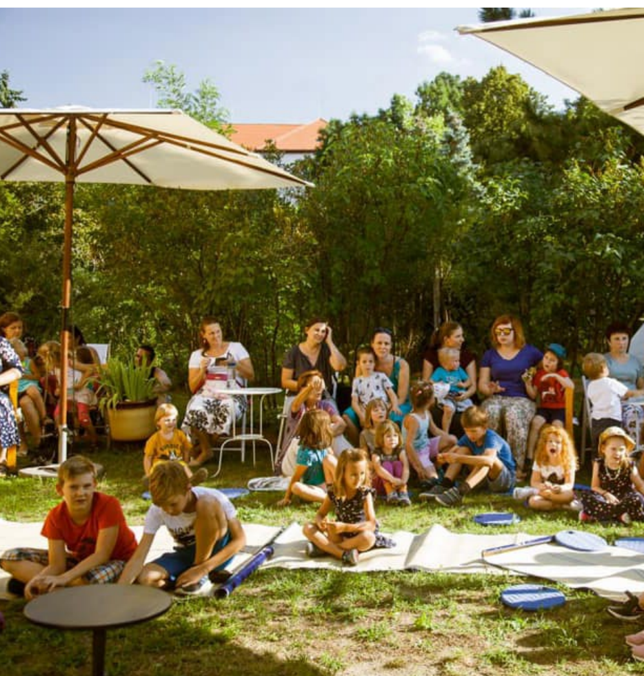
Letná čítareň, Modra

V mesiacoch s teplejším počasím je možné presunúť knižné festivaly či autorské čítania z interiéru aj do parkov, záhrad či na námestia. Okrem priestoru na socializáciu ponúkajú podobné podujatia priestor aj na vzdelávanie. Zároveň je to príležitosť na návrat do krásneho sveta kníh, ktoré sú v silnom kontraste s digitálnymi médiami, ktorými je dnešná doba presýtená.