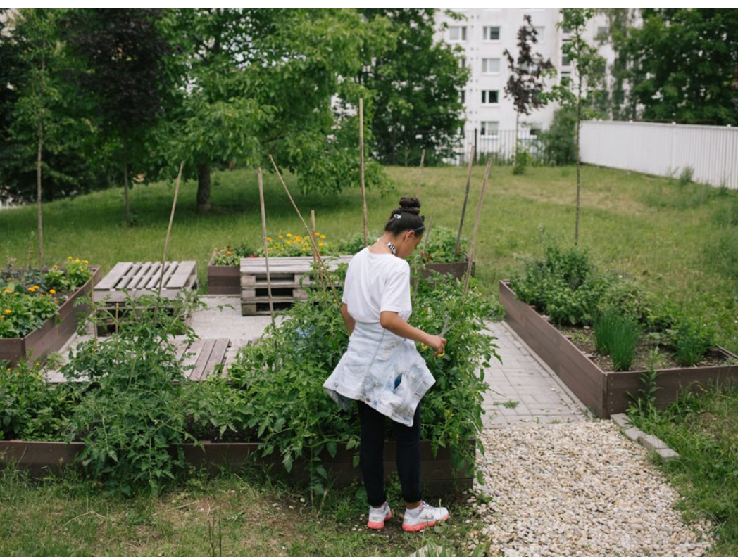
Komunitná záhrada, Výmenníky

Je to záhrada, ktorá poskytuje zázemie pre všetkých ľudí, ktorí majú záujem pestovať plodiny a tráviť čas v spoločnosti prírody. O záhradu sa stará skupina ľudí spoločne, no koncept poskytuje priestor aj pre zriadenie individuálnej záhradky. Cieľom je dať možnosť ľuďom dopestovať si svojpomocne nemodifikovanú zeleninu a ovocie aj v mestskom prostredí.