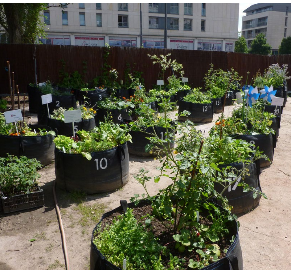
Mobilná záhrada, Varšava

Cieľom je dočasné využitie dlhodobo opustených a neupravených priestorov, ktoré čakajú na aktivitu svojho majiteľa. Ich transformáciou na živé mobilné záhrady sa podporuje citlivosť voči prostrediu, praktické skúsenosti so starostlivosťou o výsadbu, krásu/kultivovanosť okolitého prostredia a s tým priamo súvisiacu kvalitu života v bezprostrednom susedstve.