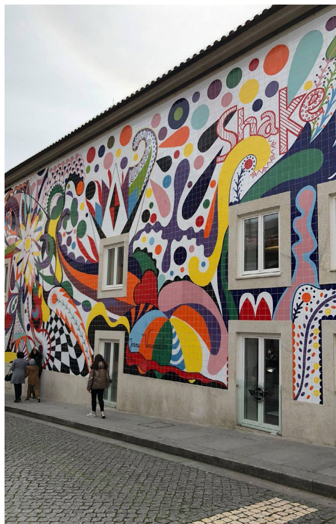
Mural na fasáde, Porto