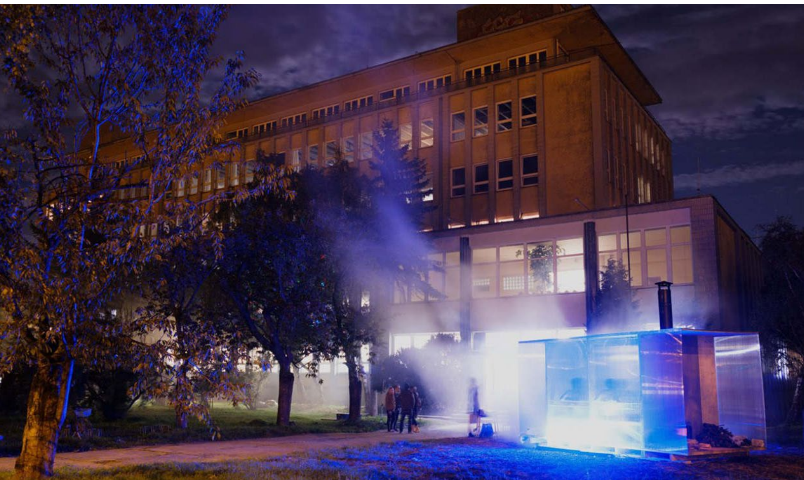
Sauna Cvernovka, Bratislava, archív Bakyta

Inštalácie v podobe malej architektúry môžu byť dočasné alebo trvalé. Okrem najznámejších príkladov v podobe kontajnerových kaviarní, to môžu byť aj spomínané pozorovateľne či vyhliadky. Rovnako ale aj drobné zariadenia rôznej občianskej vybavenosti, kreatívne parkové sedenia či miestotvorné prvky.