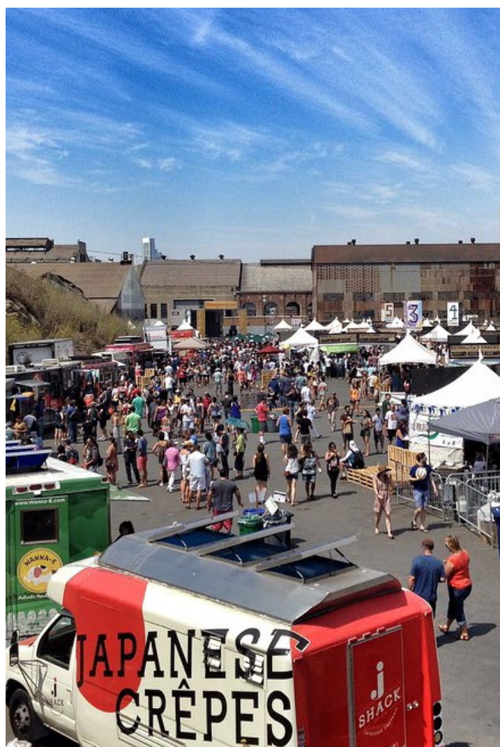
Street food festival, San Francisco