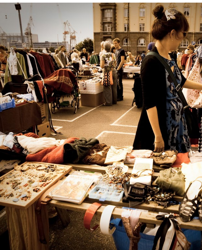
Swap oblečenia, Helsinki

Oblečenie sa stalo lacnejším a dostupnejším. Ľudia tak častokrát nakupujú aj mimo svojich reálnych potrieb. Nakupovanie sa stalo voľnočasovou aktivitou. Z ekologických a udržateľných dôvodov preto vznikol koncept "Swap", ktorý umožňuje obyvateľom mesta vymeniť si svoje vyradené kúsky šatníka za iné bez toho, aby zaťažovali ekosystém novým odpadom. Koncept sa z oblečenia veľmi rýchlo rozšíril aj na iné predmety z každodenného života, ako domáce potreby či izbové rastliny.