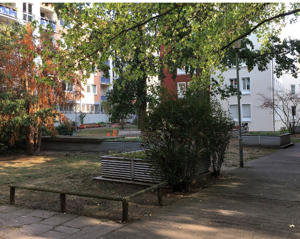
Obnova vnútrobloku

Obnova vnútrobloku môže mať podobu malých parkových úprav, inštalácie herných prvkov, novej oddychovej zóny či komunitnej záhrady. Kreatívnymi intervenciami je možné priestor spoločného vnútrobloku skrášliť a skvalitniť tým životné prostredie, ktoré susedia zdieľajú.