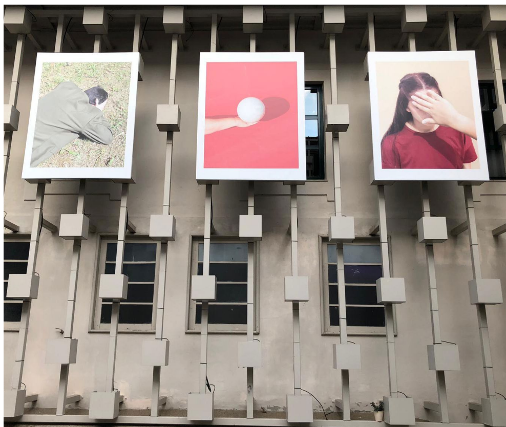
Umelecká inštalácia, Braga, archív CIKE