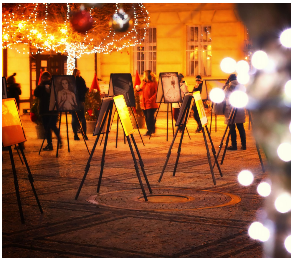
Výstava fotografií, Komárno