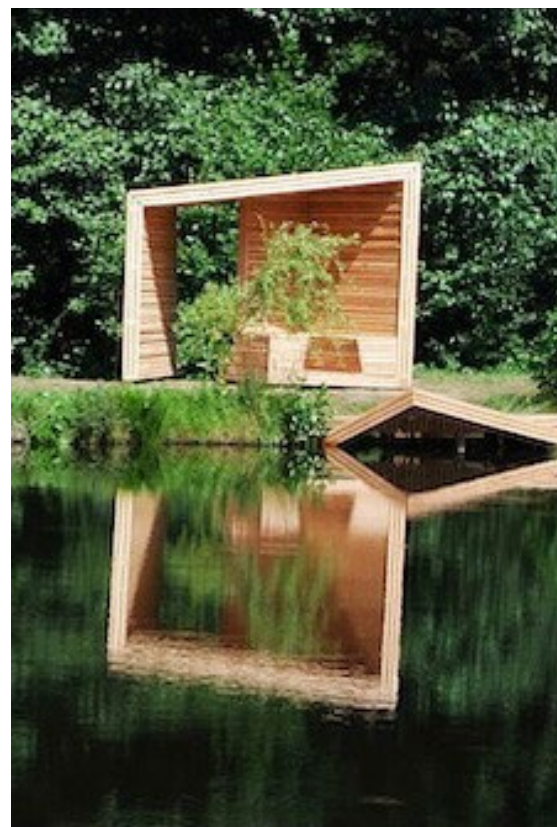
Pozorovateľňa, Trnava