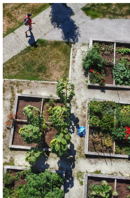
Komunitná záhrada, New Westminster