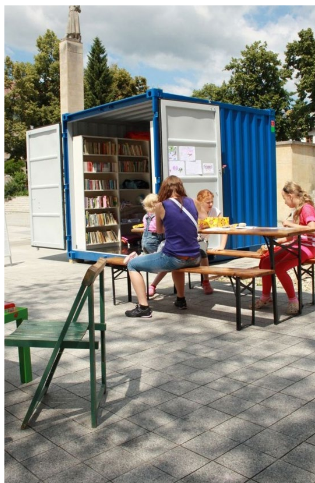
Letná čítareň, Prievidza